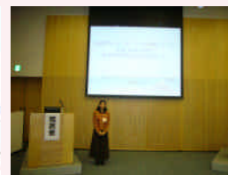
看護研究発表会（院外）