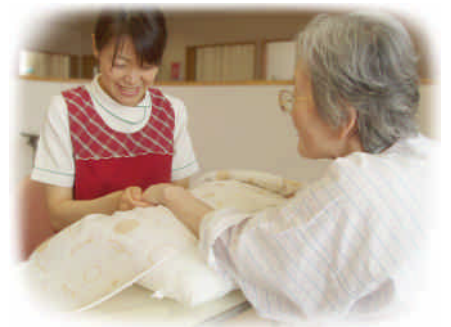
タクティールケア