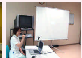
高齢者緩和ケア講習