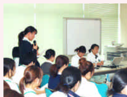
看護研究発表会（院内）